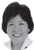
都議会議員 (江東区選出)