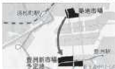
築地の移転予定地－豊洲の土壌(模式図)

東京都は都民の台所＝築地市場を江東区、豊洲の東京ガス工場跡地に移転しようとしています。長年の操業で、土壌は有害物質でひどく汚染されています。食の安全が第一の生鮮市場として、まったくふさわしくありません。